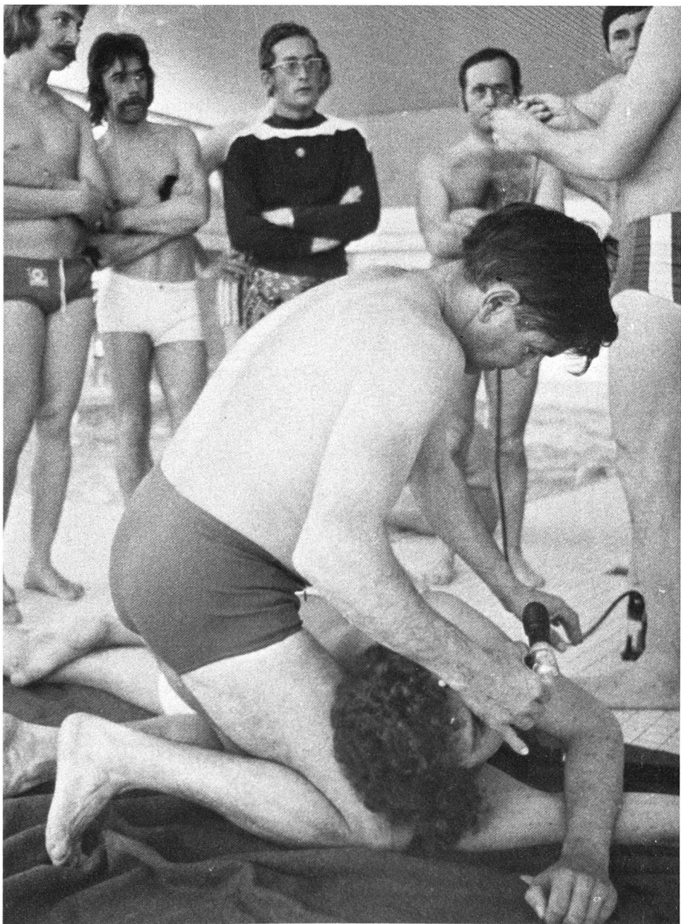
Démonstration d'un exercice de réanimation.

Une remarque importante: tous les fonctionnaires et moniteurs de cette organisation sont des membres honorifiques avec tous les avantages et les inconvénients que présente cette situation. Car si son président, Eugen Rohr, est très fier de cet état de faits,