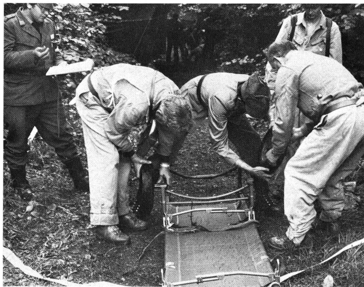
1983: civière moderne montée sur roues.

mettant au besoin à sa disposition du personnel et du matériel. Jusqu'à présent, cela ne s'est pas avéré utile, puisque notre pays n'a pas connu, heureusement, de catastrophe. Il n'en reste pas moins que les occasions de collaborer sont nombreuses et peuvent le devenir encore plus.