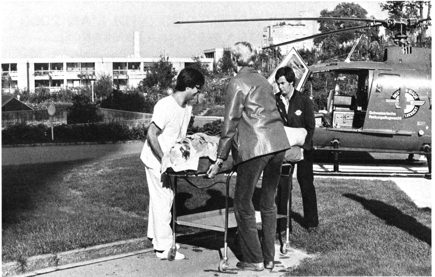
La GASS possède 2 avions-ambulances et 11 hélicoptères de sauvetage; elle dispose également de 15 bases d'intervention réparties géographiquement de manière que chaque endroit du pays soit accessible en 15 minutes de vol. Ci-dessous: la Centrale d'opération de la GASS.

quetons, pelle, etc.) ainsi que du matériel de premiers soins (perfusions, médicaments, attelle, etc.). Il transporte également un filet horizontal qui permet de monter, à l'aide du treuil, le blessé en position couchée. Ce filet est conçu de telle sorte que même un blessé souffrant de la colonne vertébrale peut être évacué de cette façon.