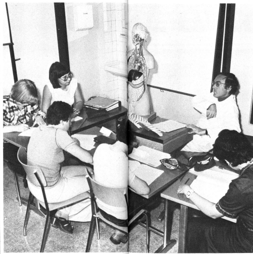
① Un médecin dispense un cours d'anatomie à de futures diététiciennes.

Selon ces prescriptions, l'âge d'admission est fixé à 18 ans révolus. Les conditions d'entrée sont les suivantes: – avoir terminé ses dix ans de scolarité en ayant suivi le programme de biologie, physique et chimie – avoir de bonnes connaissances