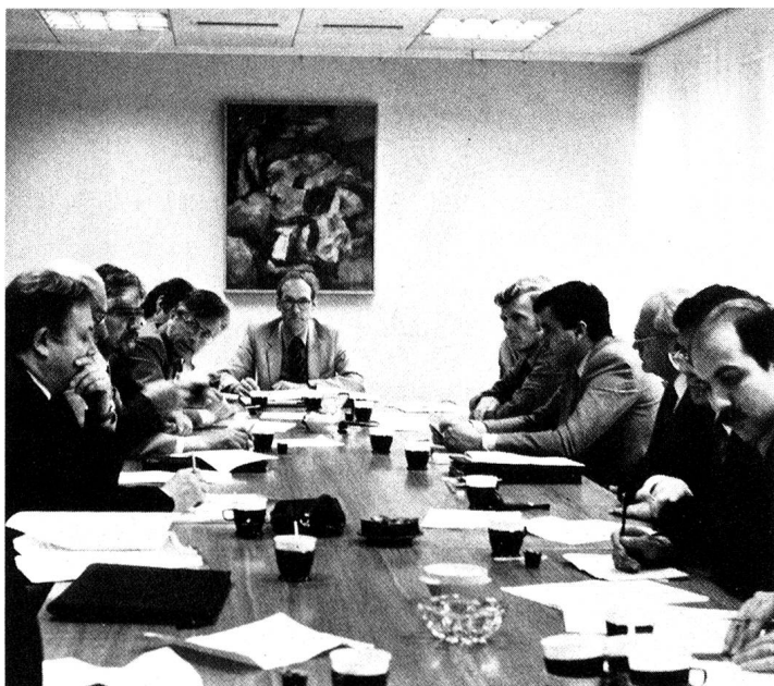
La signature de la convention, le 15 mai 1983, au siège du Secrétariat central de la CRS, à Berne.