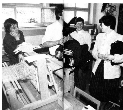
Le handicapé est entouré de ses parents, des responsables du foyer, des maîtres et moniteurs d'ateliers. La

communication et la confiance doivent s'instaurer entre eux pour que le handicapé développe son autonomie.