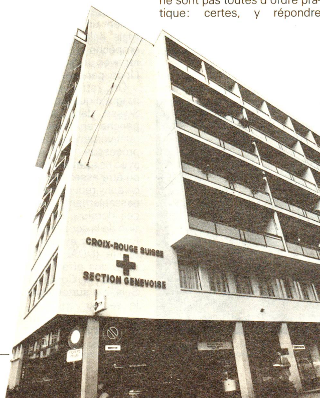
La Section genevoise: un bâtiment au 9 de la route des Acacias, mais un rayonnement dans tout le canton.