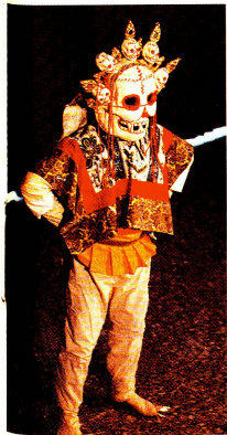
Le Dhrotsoe Dago, théâtre tibétain riche de personnages symboliques: un personnage du monde des morts et des cimetières.

Répondre à toutes les questions sur leur avenir est peut-être prématuré. Ce que révèle