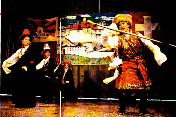
Danse rituelle qui permet de se rendre compte de la beauté des costumes. En toile de fond, le Potala, ou Palais d'hiver du Dalai-Lama à Lhassa.

des Suisses se trouvaient en Inde, pour former des groupes d'émigrants et on les a envoyés de là-bas par vagues successives, avec, comme souci principal, de faire partir et de réunir les membres d'une même famille. Une fois en Suisse, on les a placés dans des homes, jusqu'à ce qu'ils volent de leurs propres ailes et qu'ils puissent se faire une place dans notre société. Toute une aventure culturelle et sociale pour ce peuple de montagnards frustes, de moins habitués à être vénérés, de petits commerçants ou d'employés d'une administration archaïque. Que sont-ils devenus chez nous? J'observe les jeunes: si ce n'était la couleur de la peau et la forme des yeux, beaucoup ne se distin-