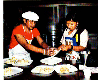
Dans les cuisines, la préparation des «momos», sorte de gros ravioli farcis.

cette fête, c'est une magnifique aventure humaine, qui fait que le Tibet, si l'on y est attentif, nous est devenu un tout petit peu plus proche. Que ce soit au sein des organisations