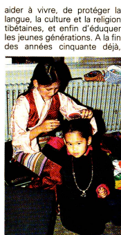
«Les Tibétains nous charment...»

Une responsable de la Croix-Rouge à qui je pose cette question me dit: «Je ne pense rien, ou plutôt, j'ai des pensées très contradictoires. Beaucoup de choses se sont passées depuis 25 ans. Les Tibétains en Suisse, c'est déjà une très longue histoire. Ils nous sont reconnaissants de les avoir aidés. Cette fête, d'ailleurs, le prouve!» C'est