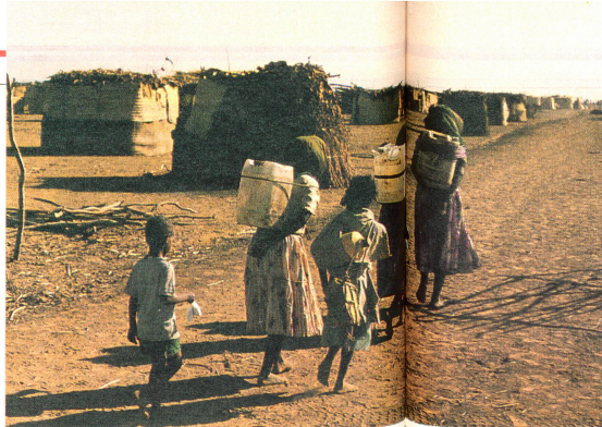
Rien ne fit tant plaisir au docteur Martin Weber que de revoir un peu de vie dans le camp.

Martin Weber ne peut s'empêcher de faire des comparai-