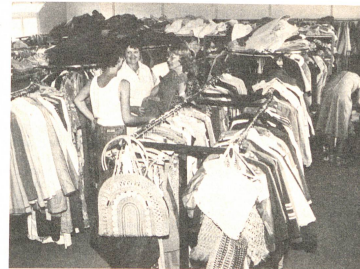
Bourse aux vêtements: Au Mourat, des habits de seconde main sont revendus à prix très bas. Et quel choix! Vous y trouverez même un «Brotz» ou une robe de mariée.

Outre la somme à débours, un autre obstacle ralentit l'installation des soins à domicile. Chacun des sept districts du canton de Fribourg possède son hôpital. Et chacun place son point d'honneur à ce qu'il tourne. Et voilà que les soins à domicile arrivent soudain comme une dangereuse concurrence qui pourrait nuire à son bon fonctionnement. Et pour cause: ils promettent une hospitalisation retardée et un retour à domicile plus rapide. C'est juste et faux à la fois.