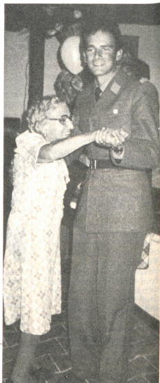
Au Gros-Prarays: Depuis combien de temps n'avait-elle plus dansé?