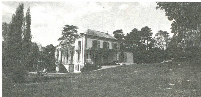
L'Institut Henry-Dunant est établi depuis 1974 à la Villa Mon Repos, au bord du lac Léman, à Genève.

L'année 1965 ne manquera pas de faire date dans l'histoire de la Croix-Rouge. Année-charnière marquée par l'effort capital d'élaborer une pensée Croix-Rouge qui soutienne l'action humanitaire, et le besoin de développer le patrimoine spirituel de l'organisation, elle a vu l'adoption, à quelques mois près, de sept principes fondamentaux et d'un Institut ou Académie Croix-Rouge. Aujourd'hui, l'Institut Henry-Dunant et les principes fondamentaux de la Croix-Rouge ont vingt ans d'âge.