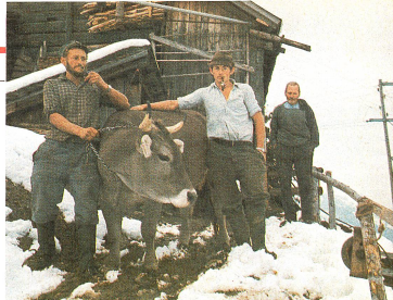
Paysans de Suisse: on a l'habitude de dire que l'agriculture en Suisse est un domaine surprotégé. Les paysans de montagne ne sont de loin pas tous de cet avis.

rience dans le tiers monde, la CRS a réalisé des projets de développement et d'opérations de secours en collaboration avec de nombreuses Sociétés nationales. Par cette coopération amicale, elle a ainsi pu créer d'excellentes relations avec ses partenaires de parole monde.