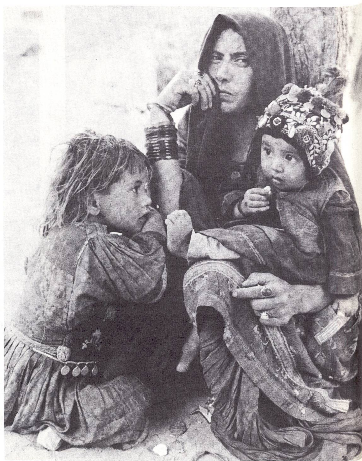
Réfugiée afghane et ses deux enfants au camp de Kot Chandana.

Environ 9 000 Pakistanais travaillent dans l'administration des programmes pour les réfugiés, quelque 8 500 autres travaillent dans les programmes médico-sociaux et éducatifs.