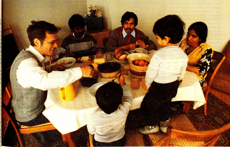
Depuis des mois, les Arumugam vivent au domicile du théologien à Gâbelbach près de Berne.