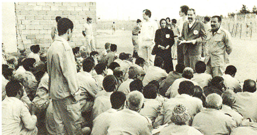
Irak, octobre 1984: libération et rapatriement de 100 prisonniers de guerre iraniens, sous l'égide du CICR.

fait suite à de nombreuses démarches qu'il a déjà effectuées sans résultat auprès de l'Iran et de l'Irak rappelant que les bombardements et attaques répétés des populations civiles constituent une violation grave du Droit international humanitaire et du droit coutumier qui proscrirent de telles pratiques. □