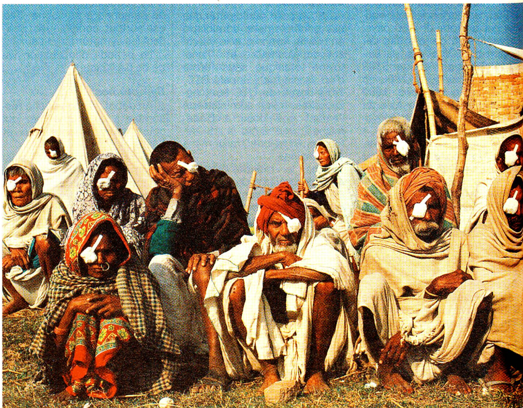
Patients opérés dans un camp ophtalmologique itinérant. Afin d'atteindre les populations rurales isolées, l'équipe de l'hôpital ophtalmologique de Népalganj profite de la saison sèche pour mettre sur pied des dispensaires itinérants, comprenant également un bloc opératoire.

L'idée du Dr Schatzmann a fait son chemin et a acquis une incontestable popularité auprès des dentistes et de nombreux patients principalement de Suisse alémanique. En Suisse romande, le succès est