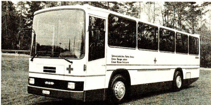
Nouvel autocar pour handicapés: Il est spécialement aménagé pour recevoir 20 handicapés en chaise roulante.

Chers parrains, chères marraines, ce sera pour vous certainement une grande joie d'apprendre que vous avez contribué, pendant ces 22 dernières années, à l'exploitation de nos trois cars pour handicapés, ainsi qu'à l'acquisition d'un nouveau car spécialement aménagé.