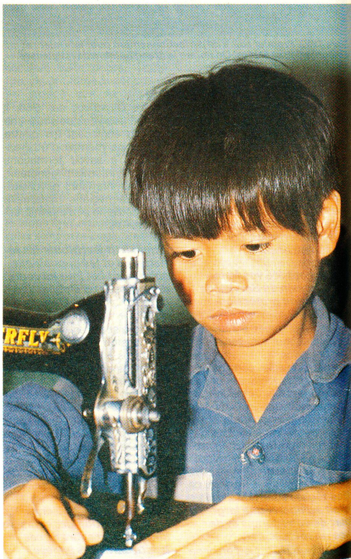
A Thuy An, près de Hanoï, la capitale du pays, des enfants victimes de guerre reçoivent une formation, visant à faciliter leur réinsertion sociale.

tivité individuelle et collective. C'est dans ce contexte qu'un nouveau projet visant à doter le district de Tinh-Bien, province d'An-Giang, d'un hôpital capable de desservir convena-