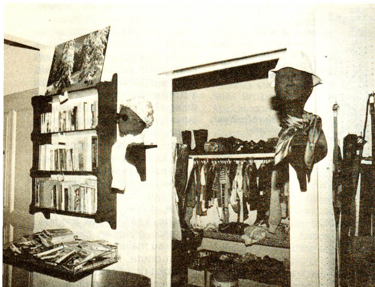
Le vestiaire: une caverne d'Ali Baba qui ne cesse de s'enrichir.

Ce dernier a recours à 35 auxiliaires de santé qui se rendent chez les malades pour des soins de base. Ceux et celles qui suivent le cours approprié obtiennent un certificat reconnu dans toute la Suisse. «Mais ce n'est pas une profes-