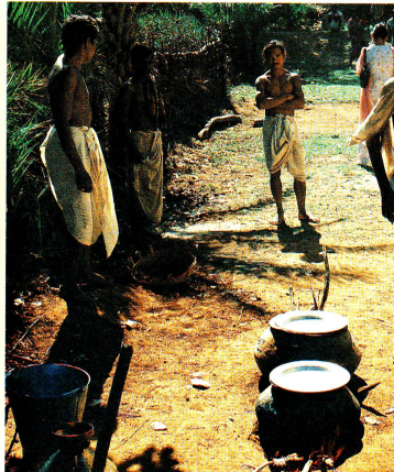
Le repas est apprêté sur des cuisines de fortune.

La petite voiture est inutilisée: le manque de pluie signifie pour les journaliers manque de travail.