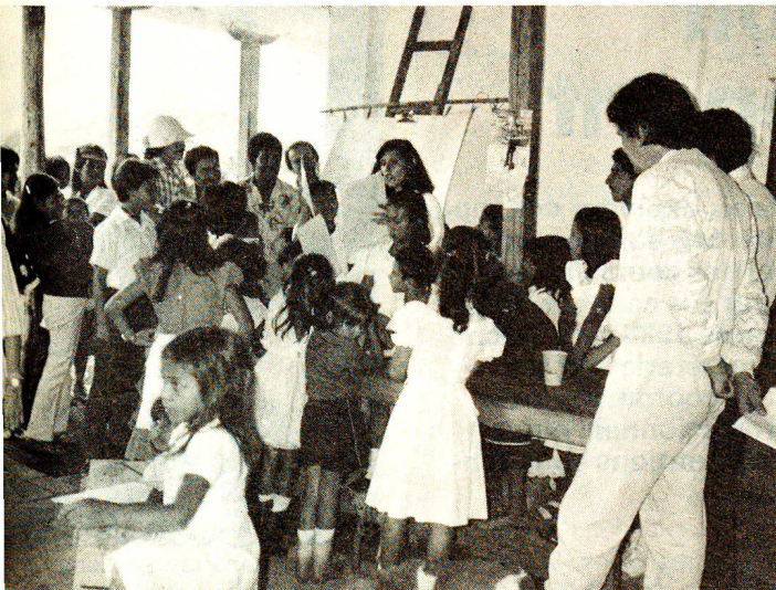
Les cours organisés avec le soutien de la Croix-Rouge suisse sont avant tout l'occasion pour les mères et leurs enfants de se rencontrer et de reprendre courage.

● Dans le cadre du centre, on aménage des viviers, on met sur pied des jardins d'enfants,