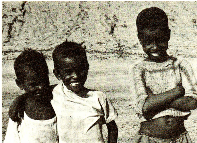
Rares sont les occasions d'apprendre quelque chose au camp. Grâce aux parrainages de la CRS, les enfants y apprennent au moins les gestes de l'hygiène élémentaire.

garde de nuit) se rend dans les sections une fois par semaine pour discuter de leurs problèmes. De nombreuses femmes participent à ces réunions et les enfants y apprennent en chantant et en jouant à se laver les mains ou à nettoyer un seau par exemple. Les réfugiés apprécient beaucoup les conseils pratiques du personnel soignant.