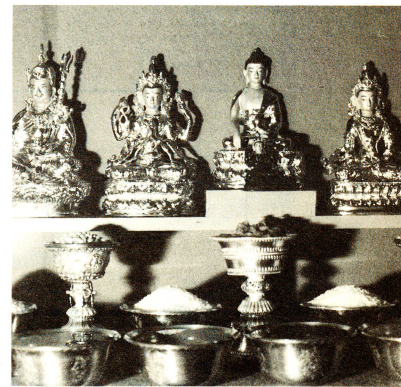
Presque chaque ménage tibétain possède son propre autel. Le bouddha au centre est entouré des déesses de la sagesse, de la miséricorde, de longue vie, etc. Devant les statuettes sont disposées des tasses d'offrande des soucoupes contenant de l'eau fraîche et des céréales.