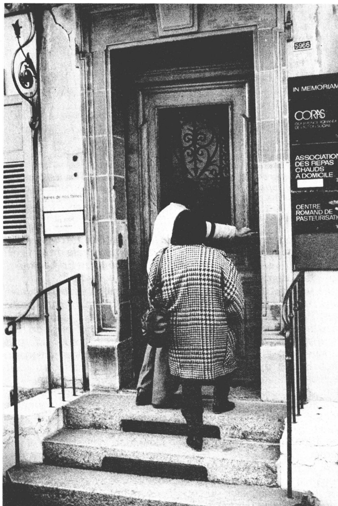
Au No 2 de l'avenue de Rumine à Lausanne, une agence de voyages pas comme les autres.

Ils ont craqué ou ont été refusés: beaucoup d'anciens requérants quittent la Suisse et son paradis perdu. Pour rentrer au pays ou tenter une nouvelle destination. Une agence de voyages très particulière, la Croix-Rouge suisse, les replace sur orbite.