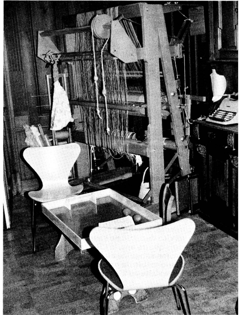
Les nouveaux locaux offrent de l'espace pour toutes sortes d'appareils d'exercice. Un jeu de football de table à pompe pour fortifier une main blessée, et derrière, un métier à tisser de haute lisse pour la mobilisation des épaules.

La Croix-Rouge jouit d'une bonne réputation aux Grisons. Toutes les campagnes auprès des donateurs ont un écho satisfaisant, les envois de vêtements parviennent en grande quantité de tout le canton, à tel point que les offices d'assistance cantonaux peuvent s'adresser à la section. Mais ne nous leurrons pas: ce que fait la Croix-Rouge exacte-