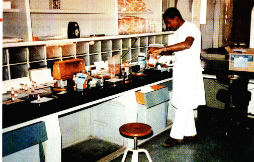
Laboratoire du centre national de transfusion de sang à Maputo.