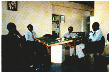
Avec les moyens du bord: dans cette entreprise à Beira, les donneurs bénévoles s'installent autour d'une ancienne table de jeu.

Nous affrontons ici les problèmes qui se posent dans d'autres pays du tiers monde: il est important d'écartier et de détruire les dons séropositifs, mais il est tout aussi important d'informer le donneur de son état de santé afin qu'il puisse prendre les précautions nécessaires. L'expérience de ces