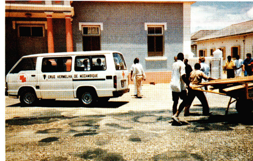
Un véhicule utilisé par l'équipe du centre de transfusion de la «Cruz Vermelha de Moçambique», la Croix-Rouge mozambicaine, qui lui a été donné par la Croix-Rouge suisse il y a plus d'un an.