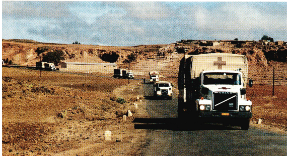
Premiers témoignages sur la situation dans le Tigré et en Erythrée