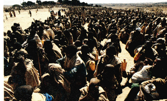
A Idaga Hamus, une foule de gens attend la distribution de nourriture.

De tous les pays du continent africain, l'Éthiopie est l'un de ceux qui ont le plus besoin d'assistance. Or, c'est le pays qui reçoit le moins d'aide au développement. Il y a des années que la production alimentaire est déficitaire: si, cette année, le déficit représente plus d'un million de tonnes de vivres, les experts estiment qu'il atteindra deux millions de tonnes d'ici 1991. Une question se pose: comment l'Ethio-