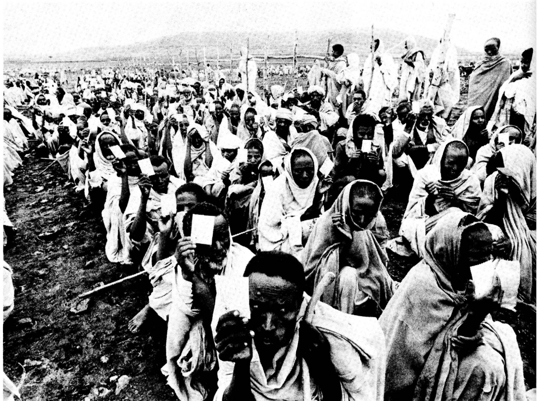
L'Ethiopie en 1985. En 1988, le CICR veut éviter le retour à une situation comme celle-ci.

De tels projets de développement ne sont jamais faciles à mettre en œuvre; or, en Ethiopie, un conflit – dont rien n'indique qu'il pourrait prendre fin – vient encore aggraver la situation de crise. □