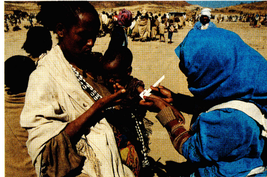
Vérification de la situation nutritionnelle des enfants selon la méthode du «Quack-stick» (mesure de la circonférence du bras et comparaison avec la taille).

Les villageois qui se sont massés à la mi-janvier à l'endroit où a eu lieu une première distribution, dans la ville de Senafe, ont décrit leur situation