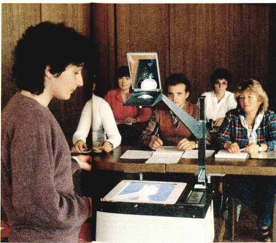
Cours de premiers secours: la principale tâche des sections de samaritains réside dans la formation de la population dans ce domaine.