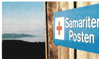
Postes de samaritains et postes d'objets sanitaires remplacent l'infrastructure qui fait défaut dans des régions isolées.

connaissances en matière de premiers secours dans le cadre d'un cours dispensé par les samaritains. Lorsqu'elles se trouvent confrontées à un cas concret, les personnes qui ont acquis les bases des premiers secours montrent une plus grande assurance que celles qui n'ont pas suivi un tel enseignement. C'est ce qui ressort d'un sondage réalisé