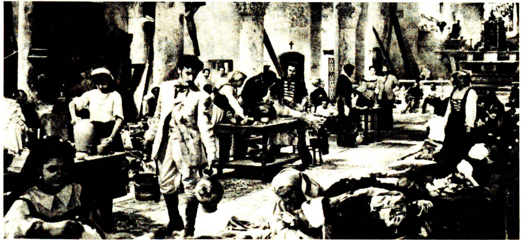
Dans l'église de Castiglione, Henry Dunant, avec l'aide des habitants du lieu, improvise une action de secours en faveur des mourants et des blessés. Photo extraite du film « D'homme à homme », de Christian Jacque (1948).

Les quatre membres de la Commission devinrent rapide-