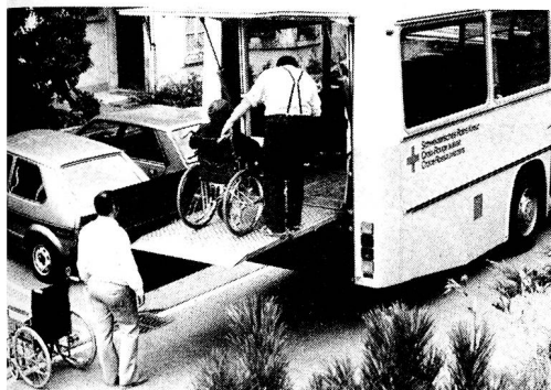
Un des trois autocars pour handicapés de la Croix-Rouge suisse: une plate-forme élévatrice facilite le chargement et le déchargement des chaises roulantes.