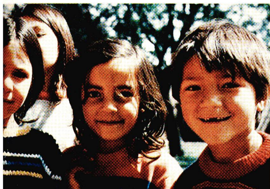
Sur le chemin de la confiance retrouvée: les enfants de la rue dans la maison de jeunesse et de l'enfance à La Plata.

Les responsables de ce centre recherchent avant tout à rétablir entre l'enfant, la vie et le monde des adultes ces rapports de confiance qui ont été détruits. «Patience, affection,