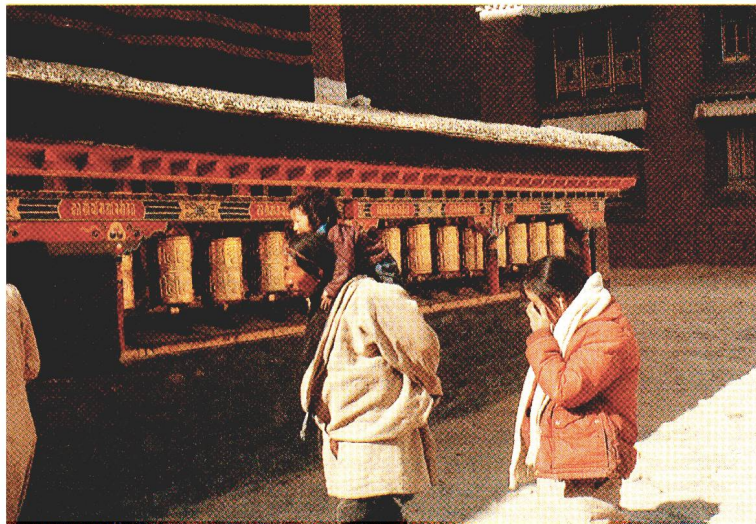
Une famille tibétaine devant le moulin à prière du couvent de Sakya, un centre religieux important. Les Tibétains sont profondément croyants et fortement attachés à leurs traditions.

Le Soudan nous paraît être un exemple parlant des activités CRS à l'étranger. Il y a quelques années, l'accent était mis sur l'assistance chirurgicale et médicale aux Érythréens, blessés de guerre ou réfugiés. Aujourd'hui, notre assistance va simultanément à deux communautés: la population soudanaise et les réfugiés. Des mères soudanaises amènent leurs petits enfants pour des contrôles ou des soins à des infirmiers érythréens tandis que des familles érythréennes accordent leur confiance totale au médecin soudanais et à ses capacités. Mais cette confiance mutuelle n'a pas été acquise en un jour. Il a fallu une longue période d'approche, de remise en question et d'adaptation réciproque à la culture de l'autre. Les tensions qui se manifestent entre la population locale, qui manque souvent du strict minimum, et celle qui afflue d'un pays voisin, «étranger», peuvent ainsi diminuer lorsqu'il s'agit d'entreprendre un effort commun pour améliorer les conditions sanitaires. □