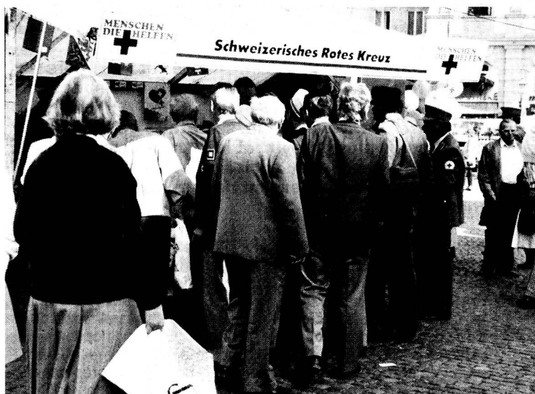
Augsbourg, lieu de rencontres pour les sociétés nationales Croix-Rouge germanophones.

Mais le véritable but de ces manifestations n'est pas, ou du moins pas seulement, d'éveiller l'intérêt de la population d'Augsbourg pour la Croix-Rouge. Le véritable prétexte de tout cela, c'est une émission télévisée diffusée en Eurovision par les chaînes allemande, autrichienne et suisse alémanique. Un show télévisé en forme d'émission de variétés, savamment orchestré et dosant subtilement la chansonnette avec les activités de la Croix-Rouge. Celles surtout qui sont les plus spectaculaires: les opérations de sauvetage et de secours d'urgence, agrémentées de témoignages émouvants de rescapés sauvés grâce à la Croix-Rouge. Une émission qui sans doute fera beaucoup pour la notoriété de notre Mouvement et qui a le mérite de réunir trois pays. Un regret tout de même, comme toujours dans les médias: le côté spectaculaire des activités de la Croix-Rouge prend le dessus. Il faut accrocher le client, c'est-à-dire le téléspectateur, trop vite enclin à «zapper» dès que son attention baisse. Mais cela, ce sont les lois des médias actuels et nous ne pouvons pas les changer... □