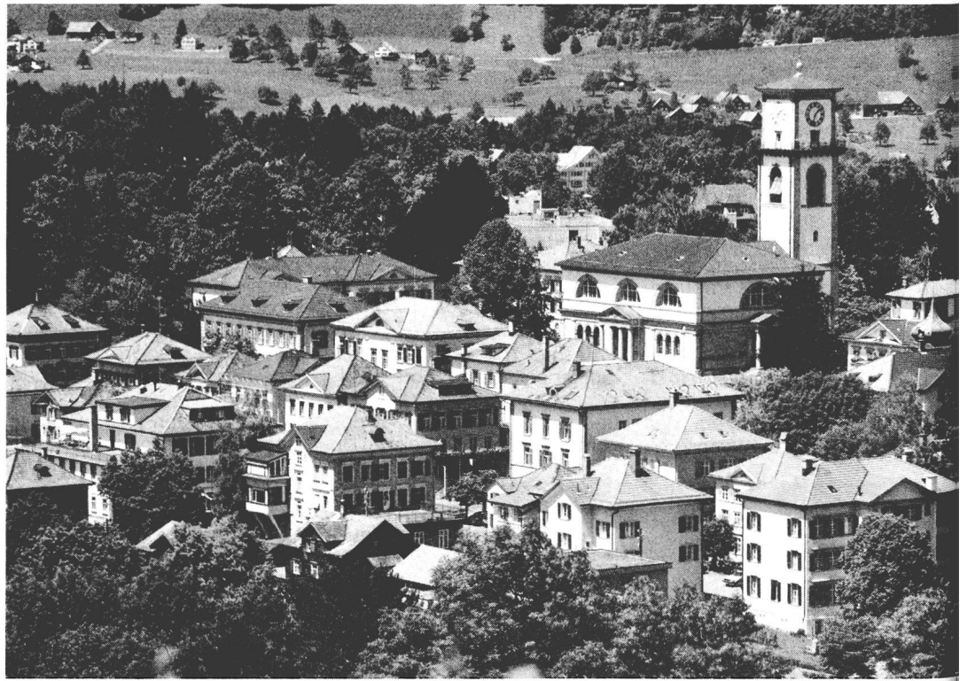
Heiden, dernière patrie du Dunant et célèbre lieu de villégiature de Suisse orientale.