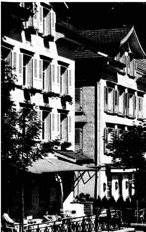
Rues ombragées et terrasses accueillantes: un agréable but d'excursion pour l'été.

Prolongement presque indispensable de la visite au musée Dunant, une petite promenade au monument Dunant, situé dans un petit square près du «Kurhotel», baptisé comme il se doit «Dunantplatz». A l'ombre des grands arbres, le monument qui représente un homme soutenant d'une main secourable son prochain et élevant l'autre dans un signe de paix vous incitera à la méditation. A moins que, ce jour-là, vous ne rencontriez par hasard quelque groupe d'admirateurs du grand homme, qui, du monde entier, viennent à Heiden honorer sa mémoire. □