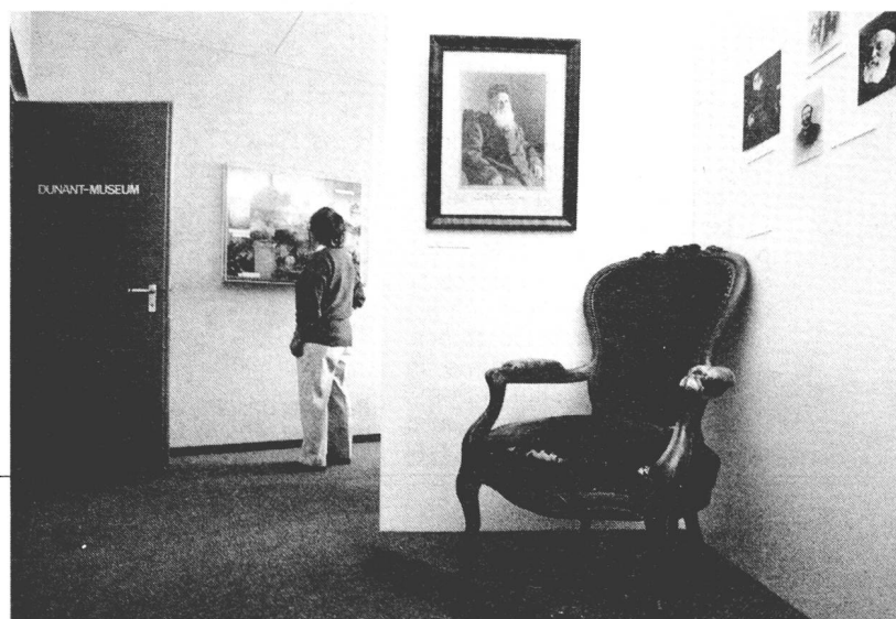
Vue de l'intérieur du «Musée Dunant» réaménagé. A droite, le fauteuil de velours rouge, une des pièces originales du musée.