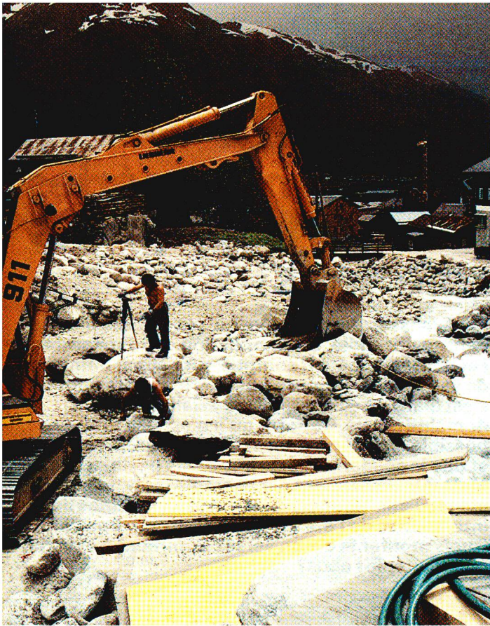
Le lit de la rivière est encore encombré de nombreux rochers qu'il faut enlever.