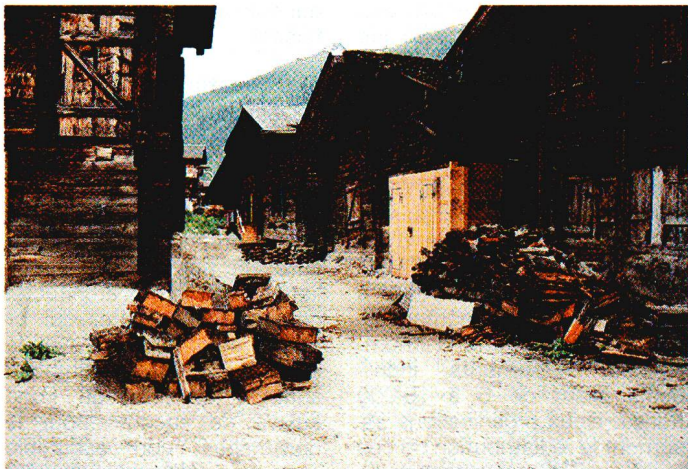
Partie du village après reconstruction. L'architecture traditionnelle haut-valaisanne des maisons du village a été préservée.