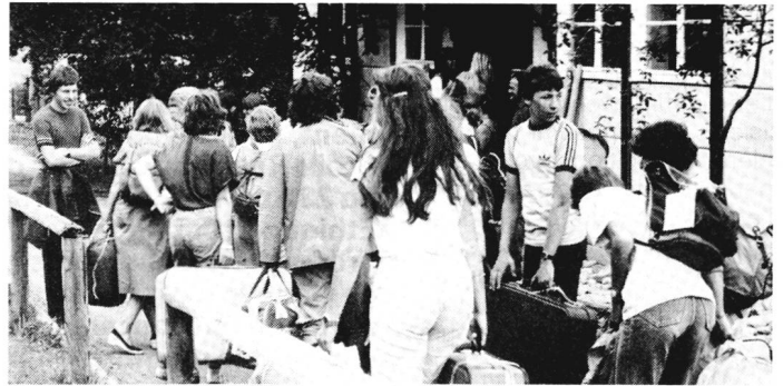
Lenk 1982. Arrivée devant les barraquements militaires de la Lenk. Pendant 17 ans les camps d'information se déroulent dans ce lieu de villégiature du Simmental.