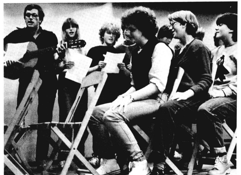
Lenk 1982. Au camp, les loisirs sont aussi organisés et partagés entre tous.