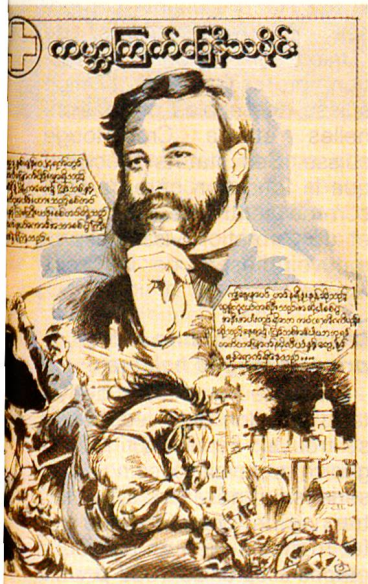
Henry Dunant, vu par les Birmanais. La vie et l'œuvre du fondateur de la Croix-Rouge reste un sujet majeur d'inspiration pour les créateurs de BD Croix-Rouge, dans le monde entier.

Le nombre et la qualité des réalisations montrent que le mouvement de Henry Dunant a su adapter la BD à ses fins. Il y a fort à parier que l'histoire de la BD Croix-Rouge ne fait que commencer. □