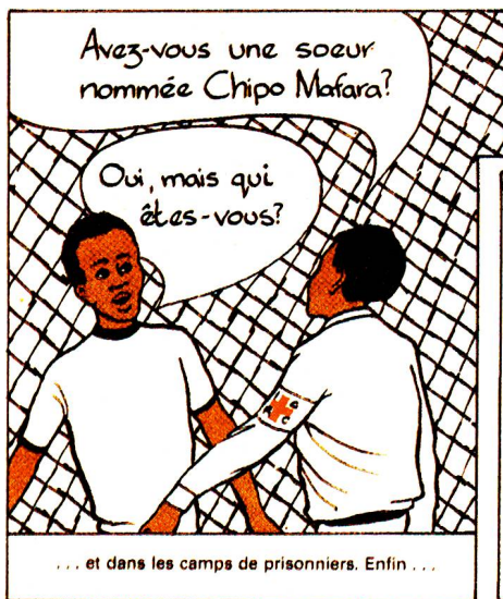
La « Famille Tenga »: distribuée dans de très nombreux pays anglophones et francophones d'Afrique, cette bande dessinée a contribué à populariser la Croix-Rouge sur le continent noir.

Il est difficile de retracer toute l'histoire de la BD Croix-Rouge. Il semble, qu'avant la guerre déjà, certaines sociétés nationales aient eu recours à cette technique pour leurs affiches de propagande. Dans un coin du stand de la Croix-Rouge à Sierre, avait été exposée une superbe affiche de la Croix-Rouge soviétique remontant aux années 20 sur laquelle des membres de la Croix-Rouge jeune enseignent à leur coreligionnaires les gestes de l'hygiène élémentaire.