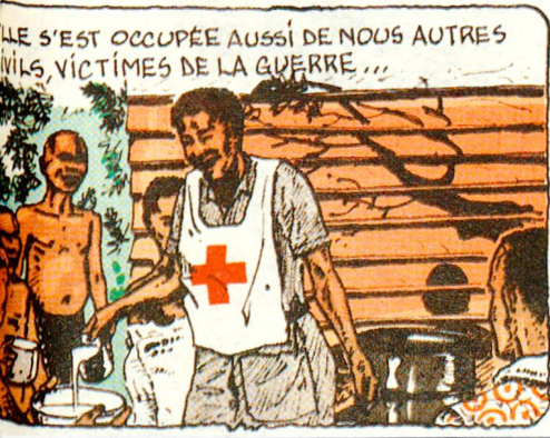
LE S'EST OCCUPÉE AUSSI DE NOUS AUTRES VILS VICTIMES DE LA GUERRE...