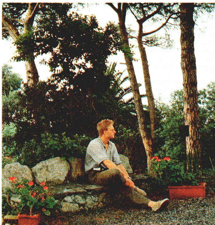
Pour de nombreux hôtes de la «Casa», une forte envie d'y revenir.

Il est ainsi des demeures qui renferment en elles comme un charme magique. C'est presque sur la pointe des pieds que l'on quitte la «Casa Henry Dunant» et son parc merveilleux en écoutant une dernière fois le souffle du vent dans les pins et en souhaitant que les nombreux hôtes qui se sont succédé ici puissent se laisser guider par l'esprit de Varazze. □