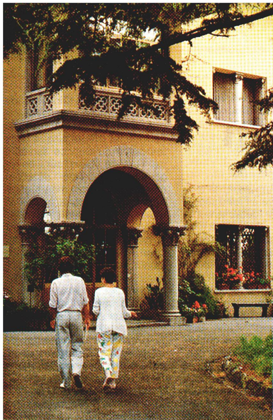
Une villa de maître au milieu d'un parc luxuriant.