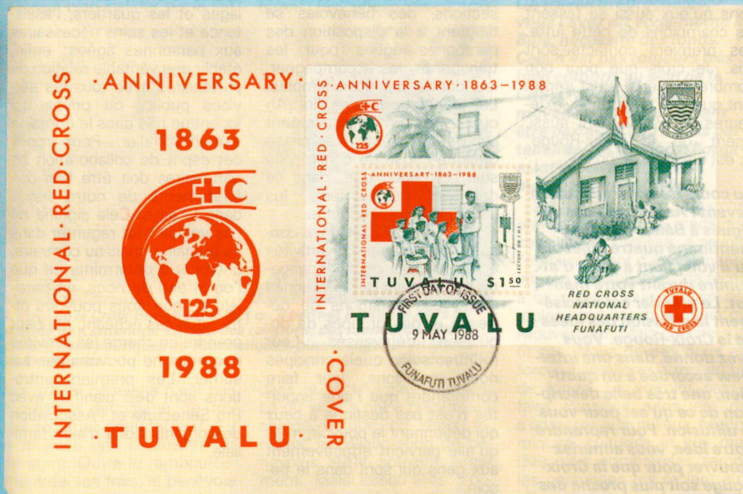
Timbre et enveloppe de premier jour reflétant l'enthousiasme de la toute jeune société Croix-Rouge de Tuvalu, un atoll du Pacifique qui a accédé à l'indépendance en 1978 et qui ne compte qu'un peu plus de 8000 habitants.

La Suisse n'est pas au rendez-vous philatélique du «125ème». Toutefois, une émission postale a eu lieu le 13 septembre dernier en prévision de l'inauguration à Genève du Musée international de la Croix-Rouge qui aura lieu le 29 octobre prochain. Ce timbre, créé par Eric Kellenberger de Corseaux, montre l'architecture du bâtiment dans toute son originalité. Selon un membre de la direction des postes, cette émission est destinée à sensibiliser le monde entier sur l'œuvre présente et passée du Mouvement. □