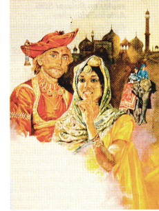
Projet de couverture pour le roman «Nabab».

«Attributs féminins», huile sur toile. En particulier dans les toiles où j'aborde le thème de la féminité. Mais au fond, je reste un figuratif, un naturaliste, un néo-réaliste même comme l'est le peintre Renzo Vespi gnani que je considère comme mon maître.