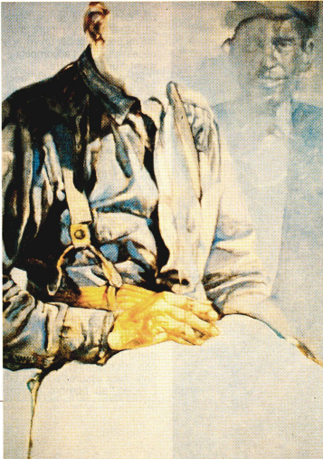
«Paysans No 1», huile sur toile.

Les prospectus peuvent être commandés auprès de la Croix-Rouge suisse, Relations publiques, Rainmattstrasse 10, 3001 Berne.