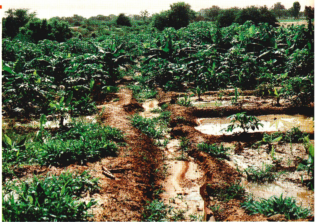
2,5 ha de terre fertile: c'est la superficie qu'a pu acquérir la section locale Croix-Rouge de Koulikoro et qu'elle a redistribué à 25 familles. Chaque parcelle est régulièrement irriguée avec de l'eau puisée dans le fleuve Niger, tout proche.