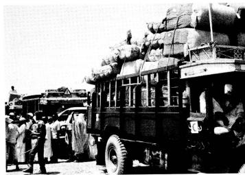
Distribution de couvertures en laine aux sinistrés. Une telle opération se fait toujours dans une atmosphère tendue. Pour éviter que la situation n'échappe à tout contrôle, une organisation irréprochable et un travail efficace et consciencieux sont indispensables.

Ceux qui, malgré toutes les difficultés, parviennent jusqu'à Khartoum, s'installent à la périphérie de la ville et attendent que le gouvernement leur attribue officiellement un endroit où s'installer. Sur une population de quatre millions d'habitants, un million vit ainsi illégalement. Sur ce million, 40 % proviennent non pas du sud, mais de l'ouest et de l'est, d'où ils ont afflué, il y a quatre ans, poussés par la sécheresse qui a frappé la ceinture