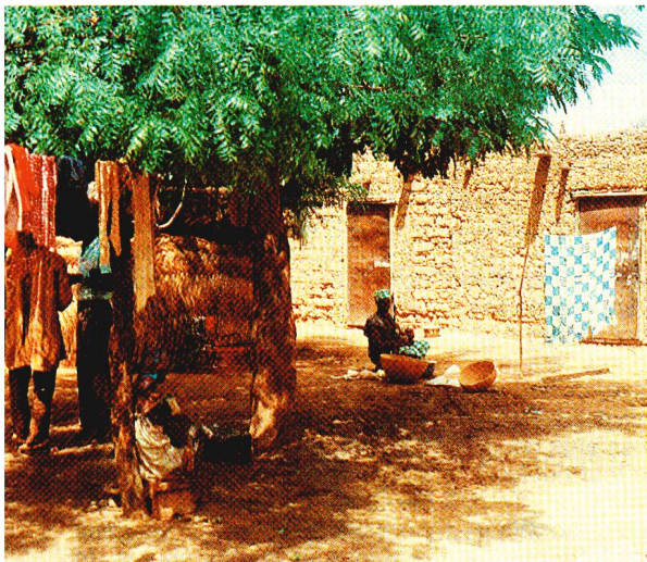
La cour, centre de la vie familiale des Diarra. A l'arrière-plan, leur habitation.

saison des pluies, qui cette année commençait à se manifester par l'apparition de bourgeons, les pluies sont abondantes, survivre en ne comptant que sur ses propres forces devient possible. Mais si les pluies sont rares, comme les habitants de Kayo l'ont déjà vécu deux fois ces dix dernières années, les jeunes pousses de mil sont détruites, et les prix des denrées sur le marché augmentent. Tous les efforts, tout le labeur ne suffiront pas à nourrir une famille.