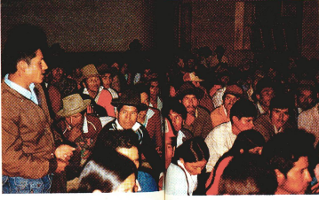
La troisième séminaire régional organisé par l'association des paysans à Redención Pampa en juillet 1988. D'importantes décisions y ont été prises concernant la coopération avec des institutions extérieures.

Le haut plateau de Redención Pampa était traditionnellement une région où l'on culti-