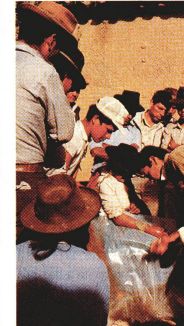
Le travail d'un auxiliaire de santé sur la place du village à Redención Pampa attire toute l'attention du public.

... déception et résignation Mais à partir de 1952, la dernière année de la révolution, l'économie nationale et régionale a commencé à tourner au déclin des paysans qui durent, dès ce moment-là, produire à des prix trop bas afin de fournir en produits alimentaires la main-d'œuvre mal payée des nouvelles entreprises dans les grandes agglomérations (usines, mines de l'Etat, industrie agro-alimentaire). De plus, de nouveaux biens de consommation quotidienne furent importés des villes vers les campagnes, créant de nouveaux besoins. Des commerçants s'établirent à Redención Pampa et se mirent à vendre leurs produits à