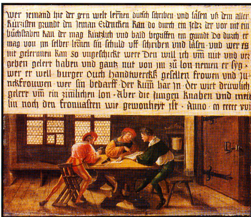
HANS HOLBEIN D.J., ÖFFENTL. KUNSTSAMMLUNG, KUNSTMUSEUM, BASEL

Dans notre société de communication, la «pub» est généralement considérée comme un outrage. En y regardant de plus près, pourtant, nous découvrons que la publicité est un art. Un art dans lequel se mire l'esprit du temps, dans lequel nous nous retrouvons ainsi que nos désirs secrets.