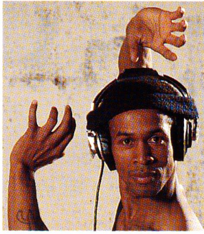
Un danseur à l'exercice. Il écoute le «son de la vie». Couverture, page 6.