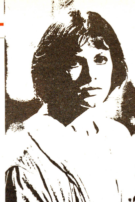
Molte donne divorziate con figli a carico ricorrono all'aiuto dell'assistenza sociale.

In Val Poschiavo, l'economia rurale, il risparmio e la mancanza dei bisogni consumistici che esistono in città, permettono alla popolazione di una certa età di sopravvivere. Inoltre, manca completamente il contesto urbano e mancano quindi i problemi elencati prima. Ritroviamo anche in questa valle casi singoli di anziani che vivono in catapecchie munite solo del minimo indispensabile. Anche qui si tratta di una scelta personale. Per semplice abitudine, essi preferiscono vivere