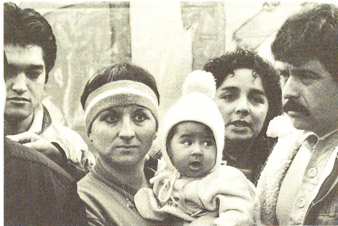
Rifugiati cileni, minacciati d'espulsione, hanno trovato scampo nella parrocchia di Seebach (ZH). I richiedenti con poche probabilità di vedersi concedere l'asilo verranno consigliati sulle modalità del ritorno nel loro paese o della partenza verso un altro paese.

Fino al 1981, anno in cui entrò in vigore la legge federale sull'asilo, la politica praticata dalla Confederazione nell'ambito dei rifugiati faceva riferimento solamente alla Convenzione internazionale del 28 luglio 1951 relativa allo statuto dei rifugiati e veniva concretizzata in base a disposizioni enunciate dal Consiglio federa-