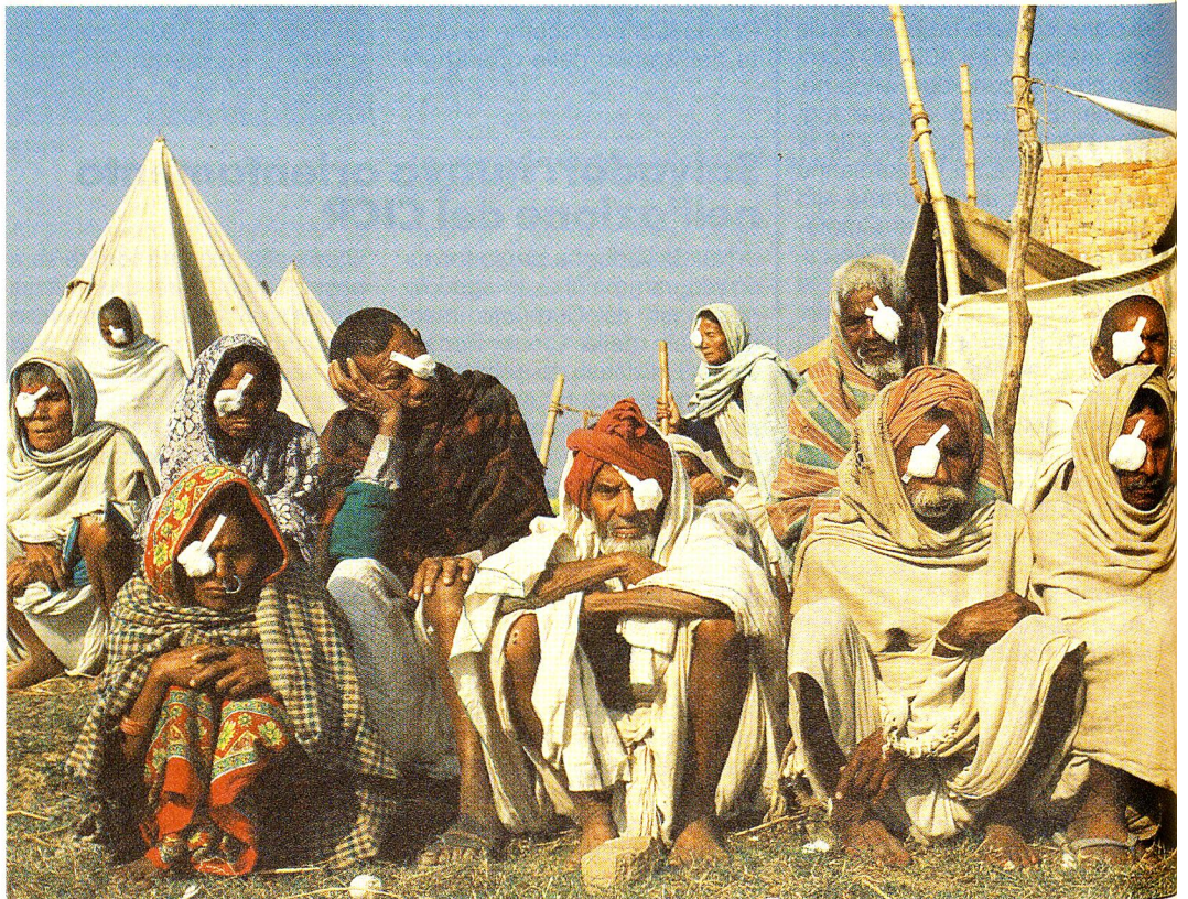
Pazienti operati in un campo oftalmico itinerante. Per poter aiutare le popolazioni rurali isolate, la squadra dell'ospedale oftalmico di Nepalganj approfitta della stagione secca per installare i dispensari itineranti, comprendenti pure un blocco operatorio.