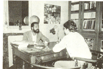
Le conseguenze della crisi sociale degli anni ottanta hanno reso necessaria la creazione di luoghi dove accogliere ed ascoltare chi ne ha bisogno. La Croce Rossa francese ha sostenuto soprattutto l'istituzione di uffici assistenziali per i «senza fissa dimora» e in genere per coloro che vengono definiti i «nuovi poveri».