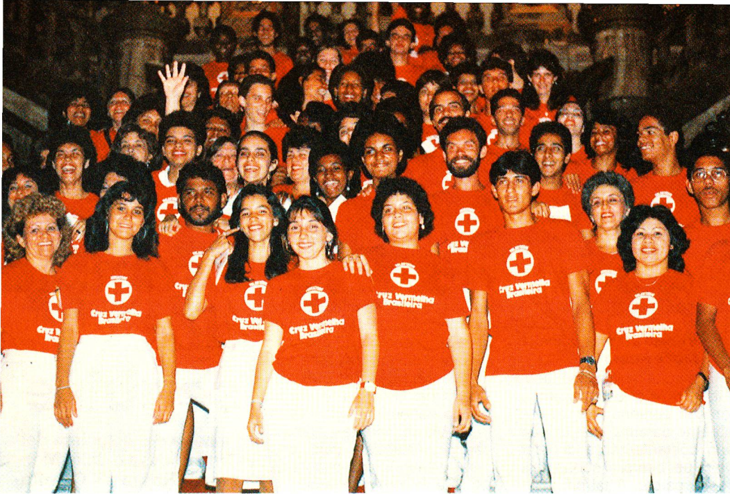
Ai volontari della Croce Rossa brasiliana il merito d'essersi occupati dell'organizzazione e degli ospiti dell'incontro internazionale.