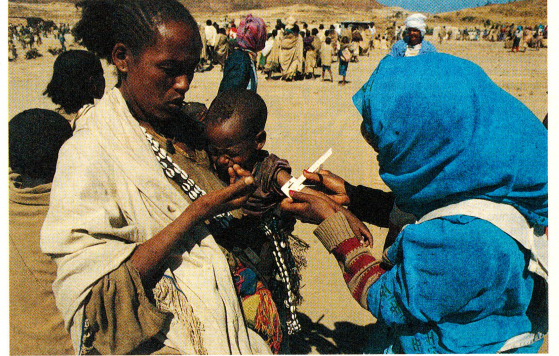
Una collaboratrice della Croce Rossa controlla lo stato nutrizionale di un bambino con l'equivalenza circonferenza del braccio — statura (cosiddetto metodo «Quack-stick»).

I contadini radunatisi a metà gennaio laddove si è svolta una prima distribuzione nella città di Senafe hanno così de-