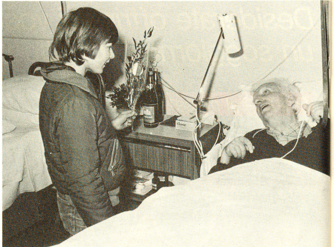
Da anni, in occasione della Giornata del malato, i volontari della Croce Rossa offrono fiori ai lungodegenti ricoverati in ospedali e in case di cura. Lo scorso 6 marzo sono stati consegnati 30 000 mazzi. Con l'azione fiori, CRS e le sue 69 sezioni regionali intendono incoraggiare altre persone a visitare i malati, non solo nella prima domenica di marzo, ma durante tutto l'anno.

Nel reparto cure intense di un ospedale ci sono pazienti che forse la vigilia erano ancora occupati alle loro faccende abituali. Ad esempio B, un ragazzo di vent'anni, e la sua amica: hanno avuto un grave incidente di motocicletta. Al giovane, i medici hanno dovuto amputargli una gamba. B giocava al calcio da semi-professionista. Dopo aver guardato innumerevoli volte sotto la coperta, incapace di rendersi conto di quanto gli era accaduto, incominciò a scherzare, di-