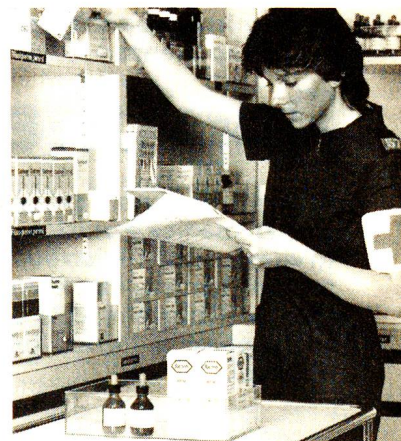
Aiuto farmacista arruolata nel Servizio Croce Rossa (SCR).

Generalmente i corsi complementari consistono nell'assicurare il funzionamento degli ospedali militari di base o dei centri per le visite di controllo sanitario degli uomini che si