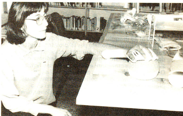
Il corso d'aggiornamento per ergoterapisti è stato essenzialmente incentrato sui nuovi metodi per la costruzione di stecche applicabili alla mano.

Questo tipo di corso, tenuto da un'ergoterapista americana in collaborazione con una ditta di mezzi ausiliari, segna una primizia nel nostro cantone, dove generalmente gli ergoterapisti seguono i corsi di aggiornamento oltre San Gottardo.