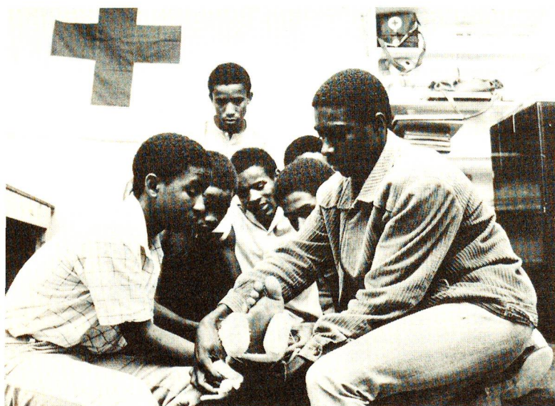
Africa: CRS promuove lo sviluppo di società nazionali della Croce Rossa, società che s'impegnano ad attuare programmi nell'ambito sanitario. Nella foto, corso di soccorritore d'emergenza.

In stretta collaborazione con gruppi locali, in Bolivia CRS sta attuando progetti in campo sanitario che includono soprattutto l'impiego delle piante medicinali. Sono stati inoltre portati a termine i programmi sanitari a lunga scadenza rea-