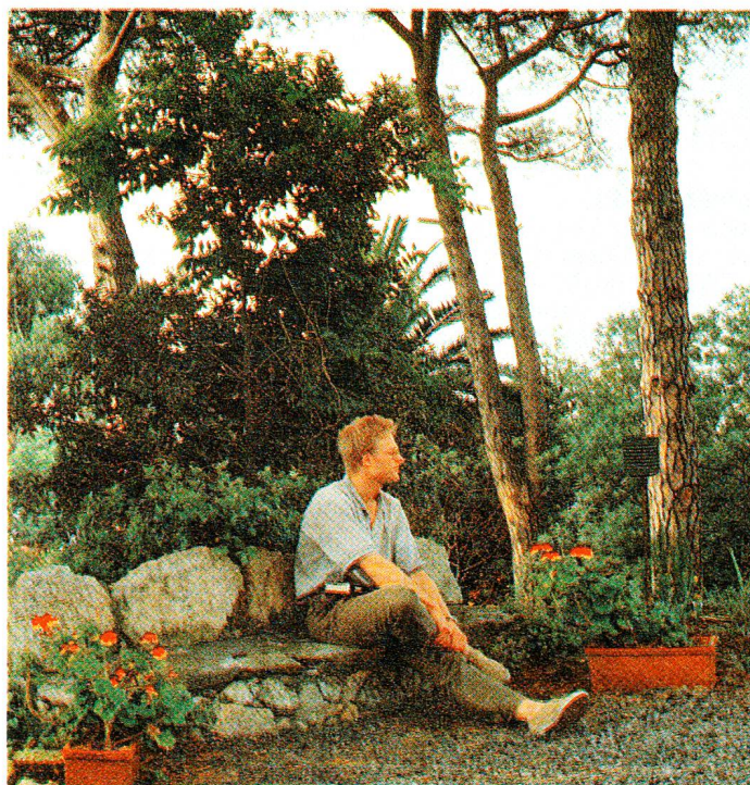
Per molti ospiti della «Casa» un irresistibile desiderio di ritornarvi.

Vi sono sicuramente abitazioni che conservano come un incantesimo. La «Casa Henry Dunant» si lascia quasi in punta di piedi, come pure il suo meraviglioso parco, ascoltando per l'ultima volta la voce del vento nei pini, nell'augurio che i molti ospiti che vi si sono succeduti possano farsi guidare da questo «spirito di Varazze». □