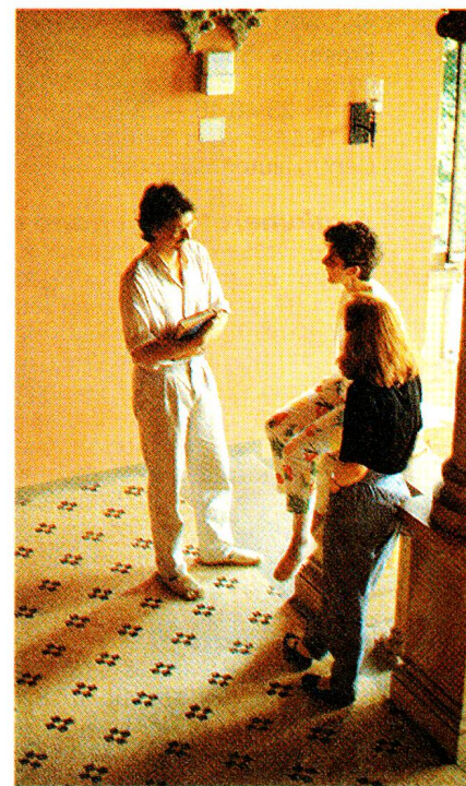
L'atmosfera particolare di questo centro è propizia agli incontri.