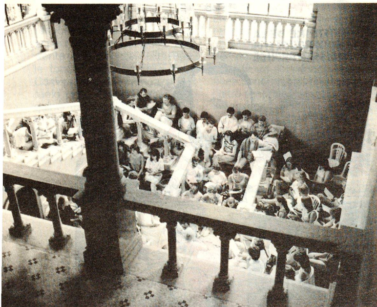
Hall d'entrata e grande scala, spazi trasformati in scuderia durante l'ultima guerra.