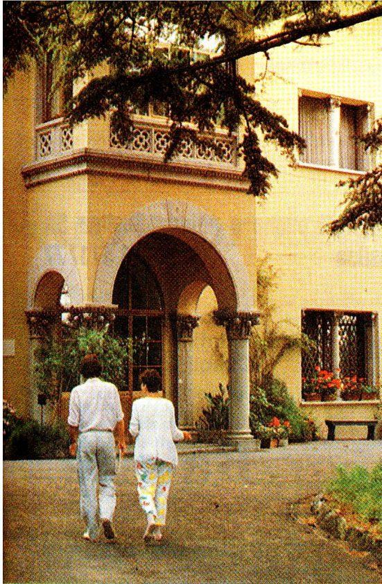
«Casa Henry Dunant»: residenza ottocentesca immersa in uno splendido parco.

uno stato di grave abbandono dalla fine della guerra e necessitava di un serio restauro. Quest'opera a lungo termine venne portata a compimento in diverse tappe; l'inizio risale al 1962, con un giovane architetto che insegnava alla Scuola professionale di Berna: Ernst Kissling. Il suo obiettivo fu subito di preservare per quanto possibile il carattere architettonico della costruzione. È soltanto grazie al suo entusiasmo e alla sua perseveranza che l'opera è stata felicemente compiuta.